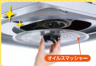
オイルスマッシャー

FUJIOHが手掛けるレンジフードのブランド「AirPRO」は、フィルターレスでお手入れ楽々。OGRシリーズはオイルスマッシャーが搭載され、油を90%キャッチするためファンに汚れがほとんどつきません。風量おまかせ運転では効率よく油煙をキャッチし省エネにもつながります。ツバメ商事でも取り扱っておりますので、気になる方はお気軽にお声掛けください。