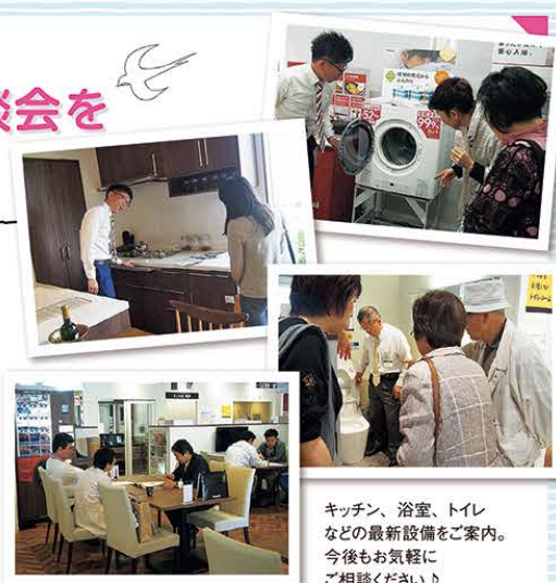
キッチン、浴室、トイレなどの最新設備をご案内。今後もお気軽にご相談ください♪

ショールームの案内やリフォームについての具体的な相談のほか、特設会場にてガス器具の販売も実施。実際に商品に触れ、使い勝手を確認できることで、理想の暮らしをイメージしやすくと好評でした。今後も皆さまのお役に立つイベントを企画してまいります♪